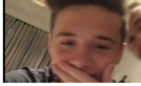
David Beckham oğlu Brooklyn'in karizmasını