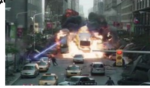
Captain America Civil War: Spiderman tarafını seçti