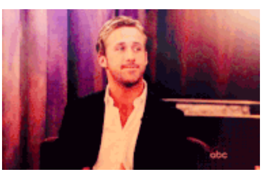
Erkeklerin Doğum Kontrol Haplarıyla İlgili Bildiği 11 Yanlış