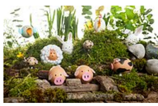
Hayvanseverlerin Her Yerinden Fışkıran 11 Minnoşluk