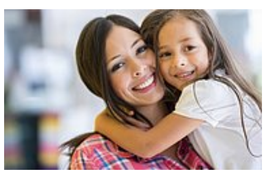
Annemize #TeşekkürlerAnne Demek İçin 10 Sebep